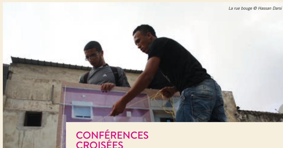
La rue bouge © Hassan Darsi

Le Royaume du Maroc, en 1947. Dans une petite bourgade, les autorités locales distribuent des sacs de farine aux nécessiteux de la région. Dans l'un de ces sacs, Mohamed Ben Mohamed découvre des billets de banque... Unique long-métrage d'Ahmed Bouanani, Mirage constitue un jalon essentiel dans l'histoire du cinéma marocain.