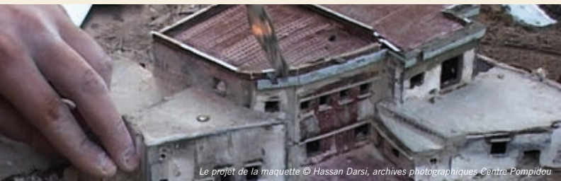
Le projet de la maquette