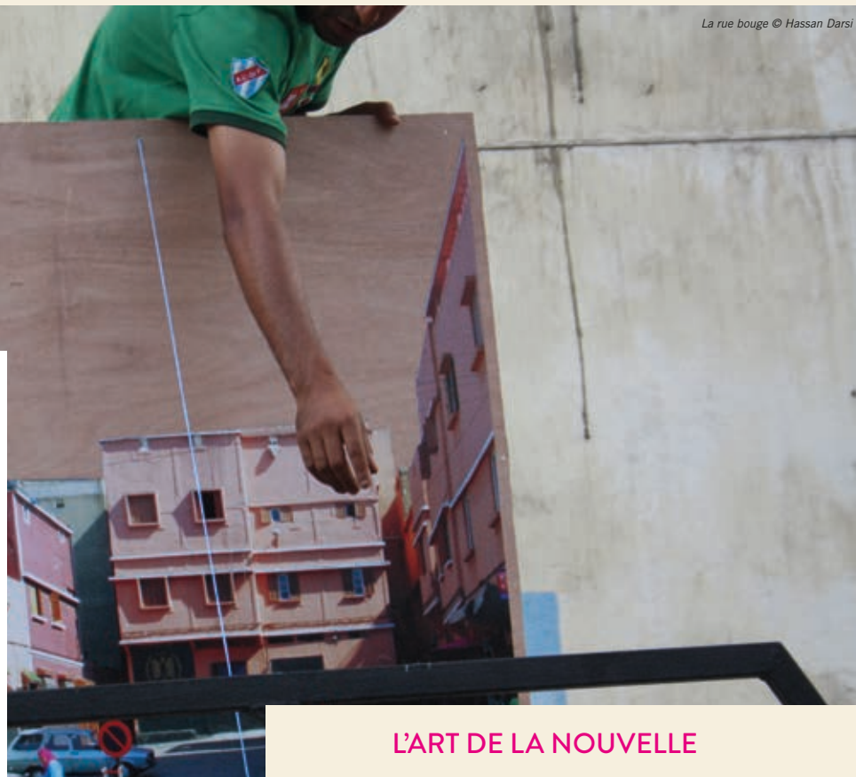
La rue bouge