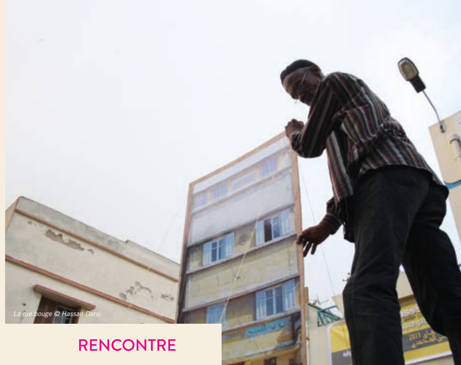
La rue bouge © Hassan Darsi